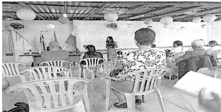
Anexos: Foto 1. Asistentes al espacio participativo MESA DE LA SALUD de Palmira de fecha 10/07/2025